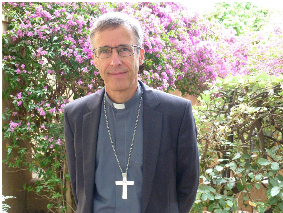
Olivier de Germai, alors évêque d'Ajaccio, en 2013.